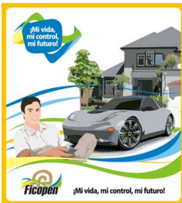
Muestra de afiche para promocionar el FICOPEN