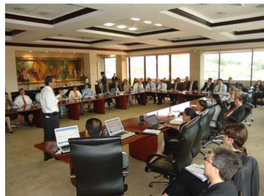
Lanzamiento de FICOPEN ante los colaboradores